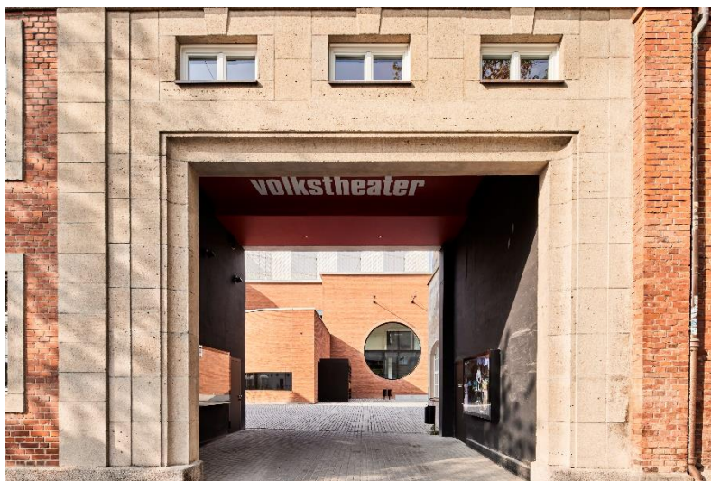
Bild 2: Einblick: Ein Zugang zum Innenhof führt durch den Bestand.