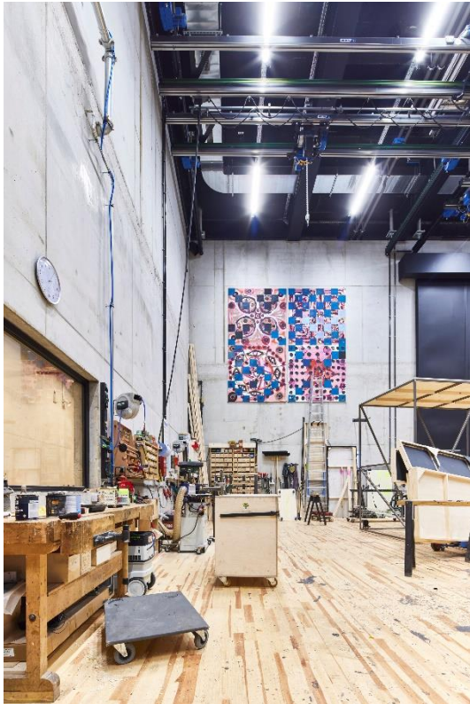
Bild 7: In der großen Werkstatt werden die opulenten Bühnenbilder geschaffen.