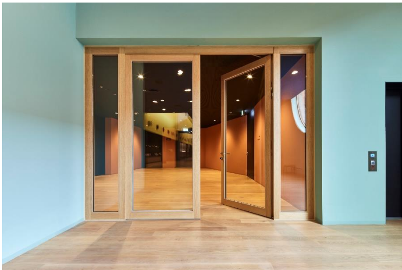
Bild 12: Optisch zum Parkett passen die großflächig verglasten, zweiflügeligen Massivholz-Rahmentüren mit T30 Brandschutzfunktion von Schörghuber.