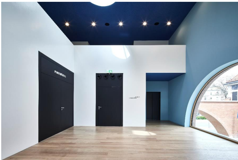
Bild 8: Wiederkehrende Gestaltungselemente sind die Oberblenden der Schörghuber Türen.

Download Texte und Bilder: www.schoerghuber.de/presseforum