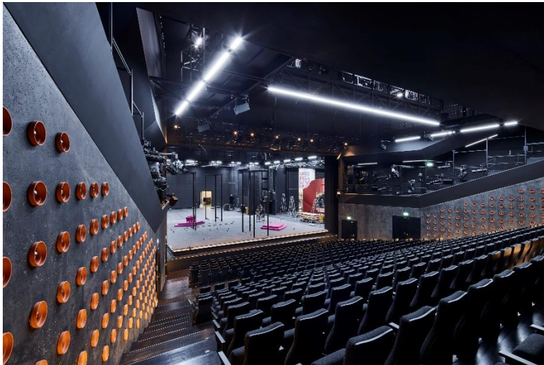
Bild 6: Im großen Saal sind zu Leuchten umgenutzte Tontöpfe das einzig farbige Element – neben dem Bühnenbild, natürlich.

Bild 5: Die Schörghuber Türen an der langen Bar haben eine schwarz gebeizte Oberfläche aus Kiefernholz furnier mit sehr feiner Maserung.